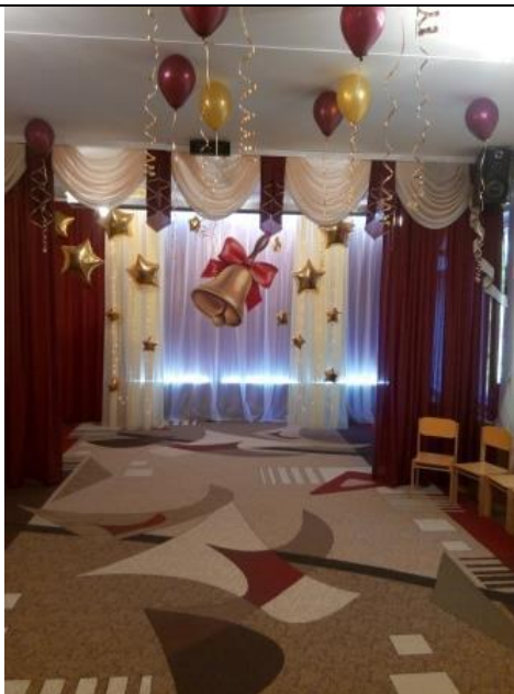
№ 7 Зона целевого назначения здания (музыкальный зал)