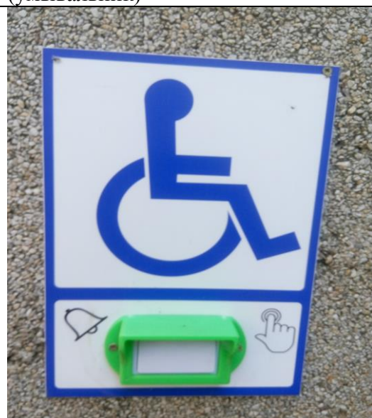
№ 12 Система информации и связи (кнопка вызова)