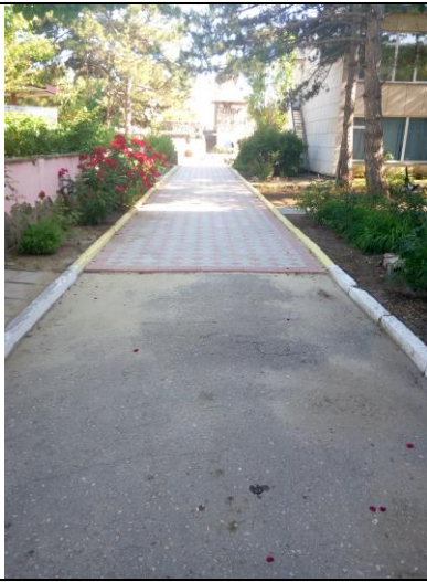
№ 13 Путь движения на территории