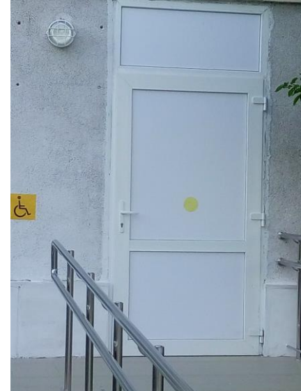
№ 18 Дверь