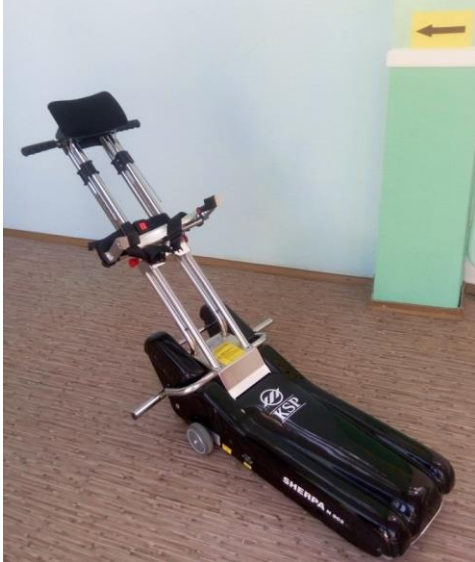
№ 17 Лестничный гусеничный подъемник