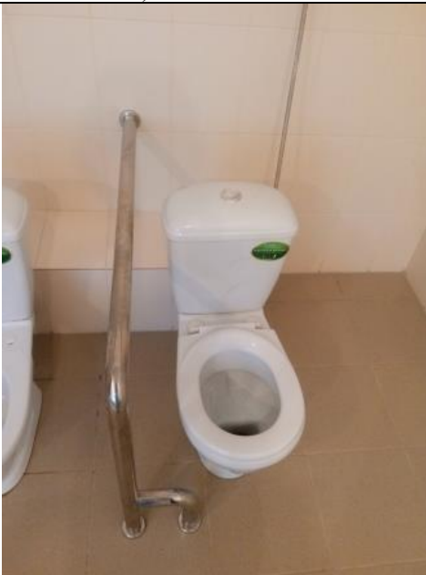
№ 9 Санитарно-гигиенические помещения (туалет)