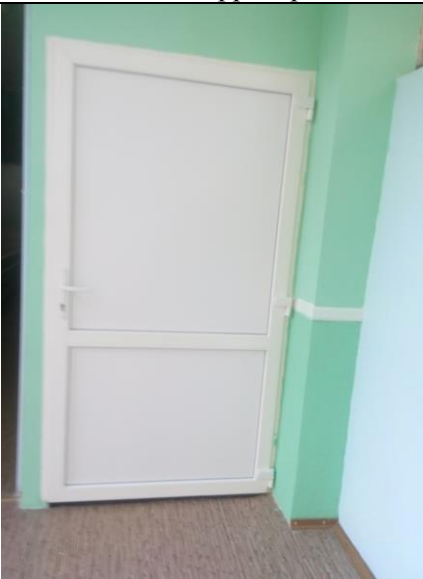
№ 15 Дверь (входная)