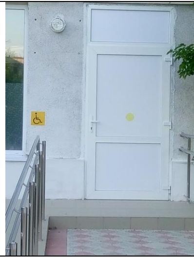
№ 14 Входная площадка (перед дверью)