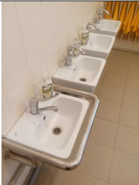
№ 10 Санитарно-гигиенические помещения (умывальник)