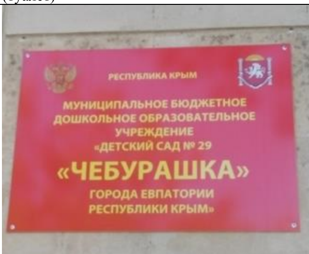
№ 11 Система информации и связи (вывеска)