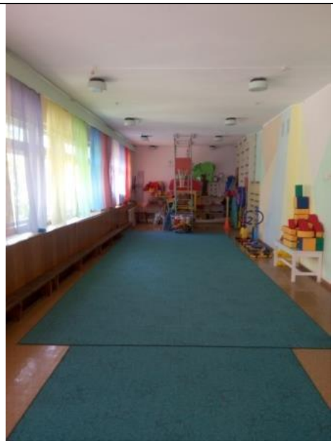
№ 8 Зона целевого назначения здания (спортивный зал)